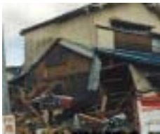
1階の一方の壁量が不足していた。