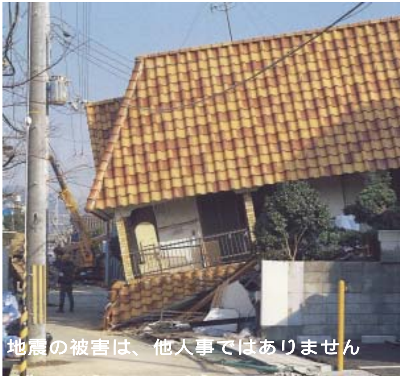
地震の被害は、他人事ではありません