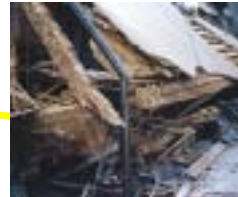
腐朽・蟻害により倒潰

壁面だけの工事なので工事中の不自由は最小限！ 廃材処理を抑え環境にやさしい！ ホルムアルデヒド規制対象外製品で健康にも安心！