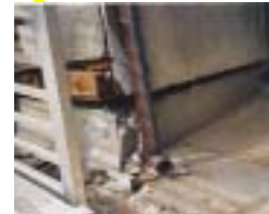
柱・土台が浮いている